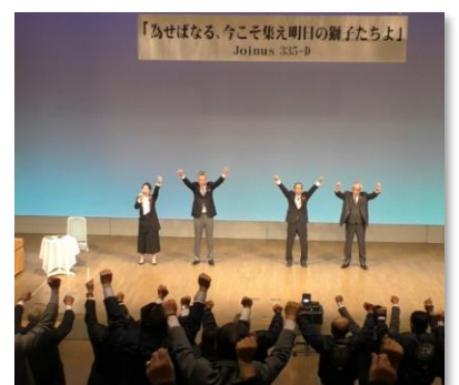
コーディネーター4名の シュプレヒコール